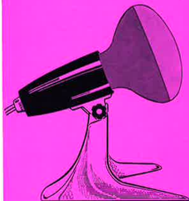
Haltegerät G 157 mit Strahler