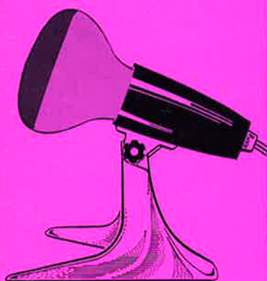
Haltegerät G 157 mit Theratherm-Strahler 250 W