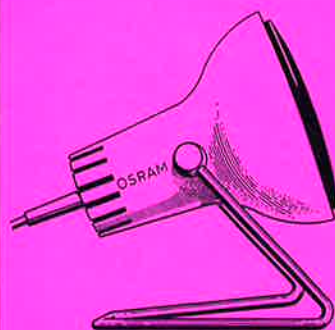
Haltegerät G 166 mit Strahler

Die angegebenen Preise sind empfohlene Preise.