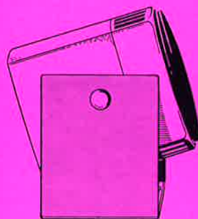
Haltegerät G 265 mit Strahler